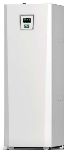
CTC EcoPart 400 Pro * Basic