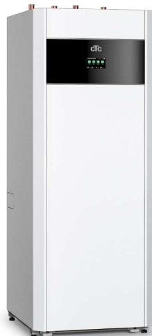
CTC EcoPart i600M * Basic