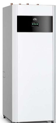
CTC EcoPart i600M