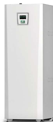
CTC EcoPart 400 Pro