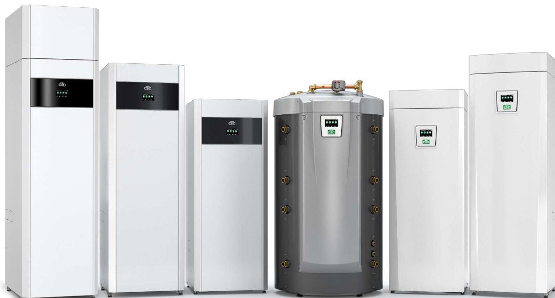
CTC EcoVent i360F

– se respektive produktark for mer informasjon.