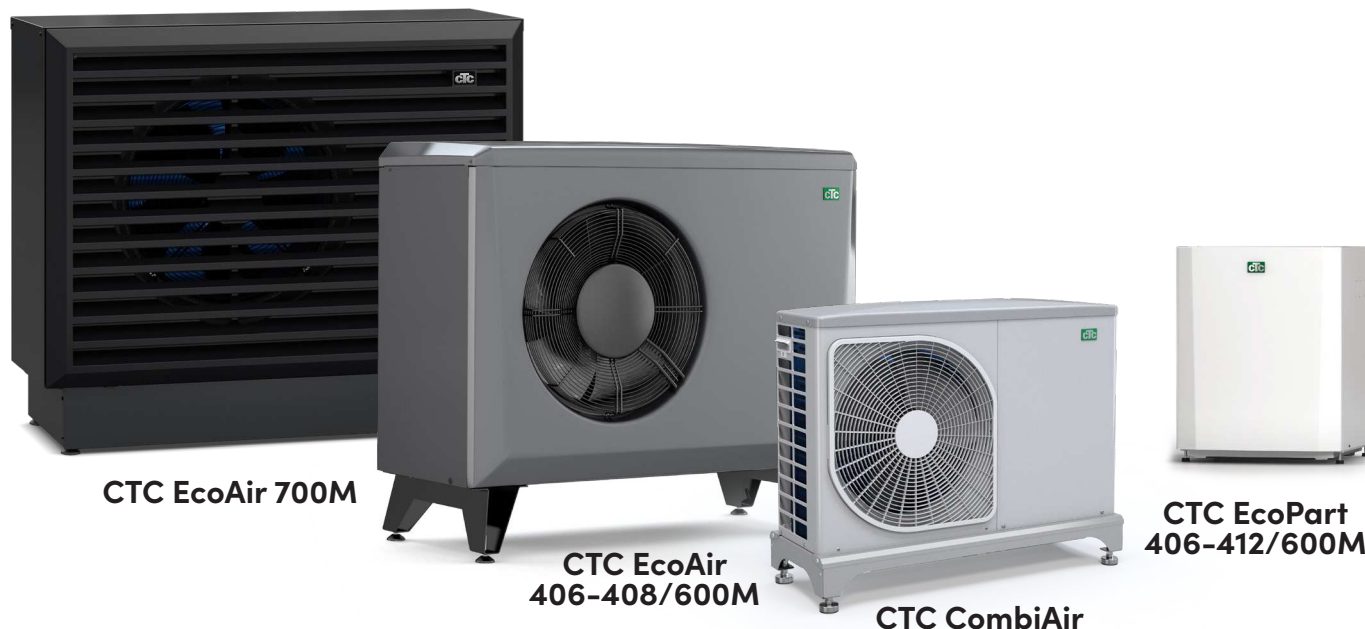
CTC EcoAir 700M

– for mere udførlige oplysninger henvises til de pågældende produktblade.